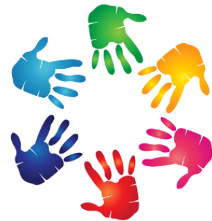
Gemeinnützige Institutionen u.a.